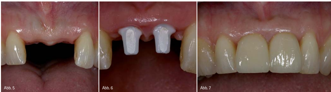
Abb. 5: Ausgangssituation nach Verlust der beiden mittleren Frontzähne. Die Interdentalpapille ist durch die Versorgung mit einem abnehmbaren Interimsersatz weitgehend zerstört. – Abb. 6: Zustand nach umfangreicher Weichgewebsaugmentation und Insertion von zwei Implantaten mit vollkeramischen Aufbauten (Cercon Balance, DENTSPLY Friadent, Mannheim). – Abb. 7: Insertion der vollkeramischen Suprakonstruktion (Cercon Smart Ceramics, DeguDent, Hanau) mit verlängerter approximaler Kontaktlinie zum Verschluss der approximalen Zwischenräume.

tieren. Auf der Basis der vorliegenden Untersuchungen führt dabei das Platform Switching zu einer verbesserten Stabilität der periimplantären Hart- und Weichgewebe. Eine laststabile und bewegungsfreie Verbindung von Implantat und -aufbau, wie sie durch konusförmige Verbindungen erreicht werden kann, ist ein weiteres positives Konstruktionsmerkmal zum Erhalt der periimplantären Hart- und Weichgewebe. Abgesehen vom Implantatdesign sollten für festsitzende Versorgungen im Frontzahnbereich auch präfabrizierte vollkeramische Abutments auf Zirkonoxid zur Verfügung stehen. Zirkonoxid-Abutments haben eine deutliche höhere Bruchfestigkeit als die schon seit längerer Zeit bekannten Vollkeramikaufbauten aus Aluminiumoxid. Dies reduziert das Risiko einer Abutmentfraktur.